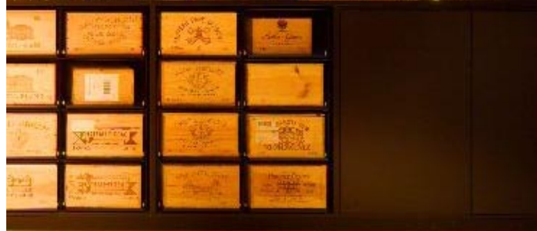
So sieht das Paradies aus: Der luxuriös ausgestattete Weinkeller mit den massgefertigten Regalen ist der Stolz des Hausherrn.

tekten befassen sich vor allem mit Wohnungs-, und Gewerbebau und erstellen Bauten im Gesundheitswesen. Vermehrt möchte man an Architektur-Wettbewerben teilnehmen. Von den ersten strategischen Überlegungen über die Formulierung präziser Konzepte bis zur Planung und Ausführung bieten Merlo Zehnder sämtliche Teilleistungen an. «Wir befassen uns eingehend mit den gesellschaftlichen und kulturellen Veränderungen, den sich wandelnden Anforderungen an die Gebäude und den technischen Entwicklungen im Baugewerbe», sagen die Architekten. www.merlozehnder.ch