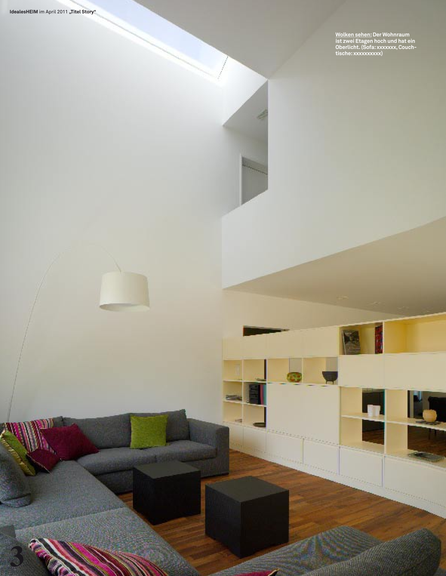
Wolken sehen: Der Wohnraum ist zwei Etagen hoch und hat ein Oberlicht. (Sofa: xxxxxxxx, Couchtische: xxxxxxxxxx)