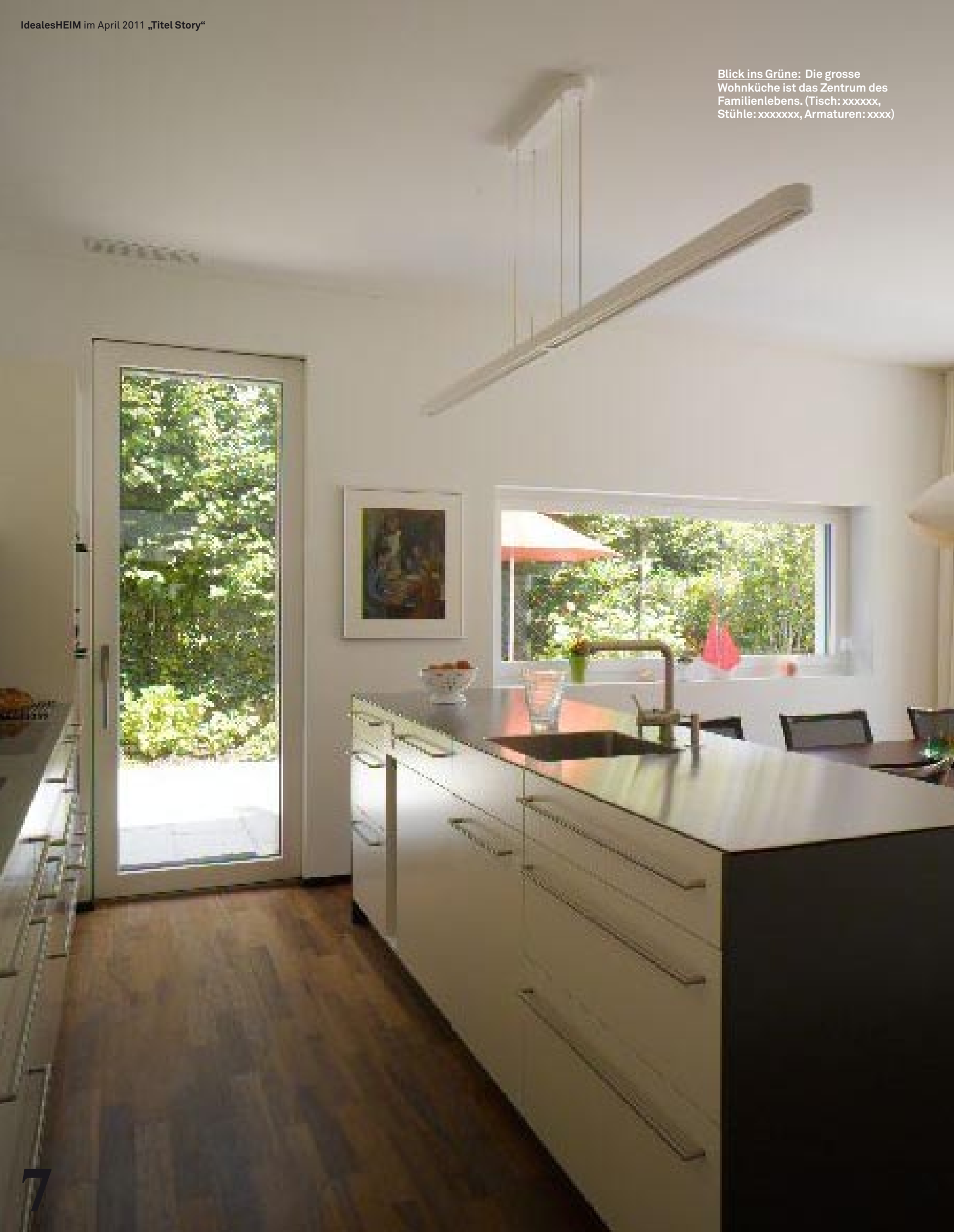
Blick ins Grüne: Die grosse Wohnküche ist das Zentrum des Familienlebens. (Tisch: xxxxxx, Stühle: xxxxxxx, Armaturen: xxxx)